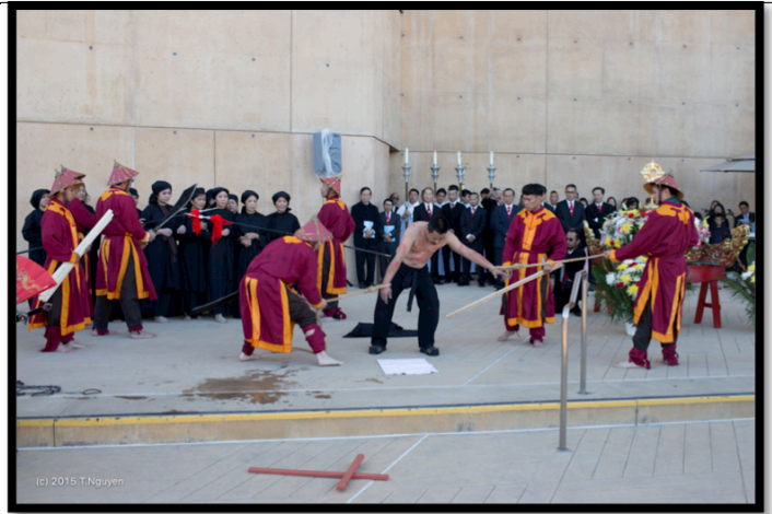
Diễn nguyện Các Thánh Tử Đạo Việt Nam