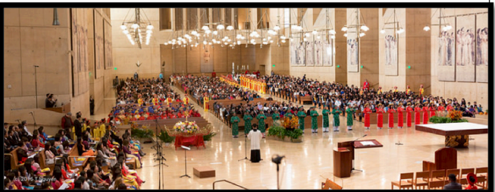
Quang cảnh Lễ Bồn Mạng bên trong Nhà Thờ Chánh Tòa