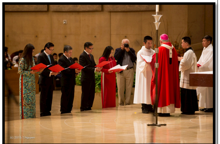
Tân Ban Thường Vụ Cộng Đồng tuyên thệ nhậm chức