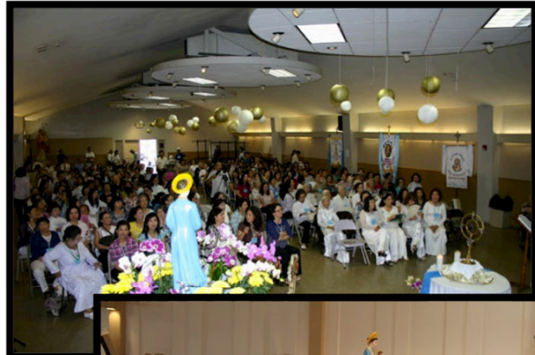
Tham dự giờ tĩnh tâm