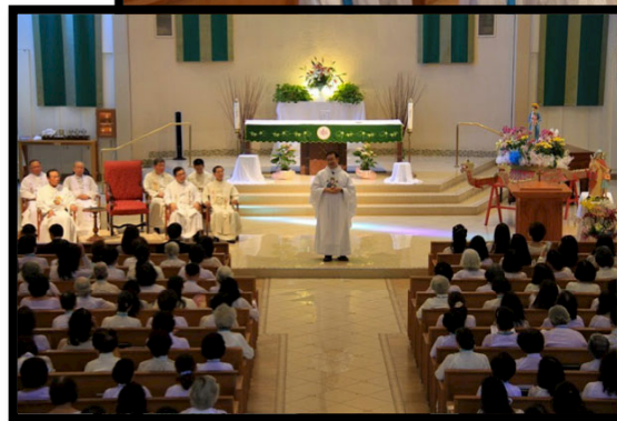
Thánh lễ Bốn Mạng