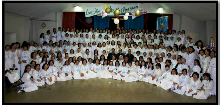
Tất cả hội viên chụp hình lưu niệm