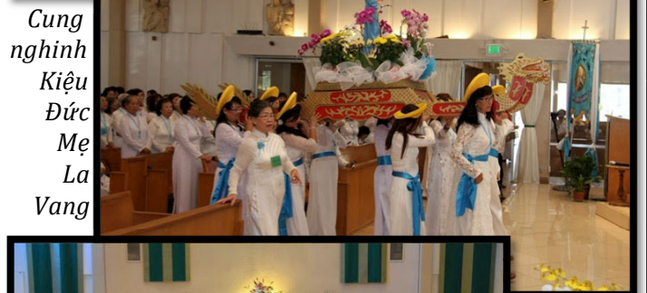
Cung nghinh Kiệu Đức Mẹ La Vang