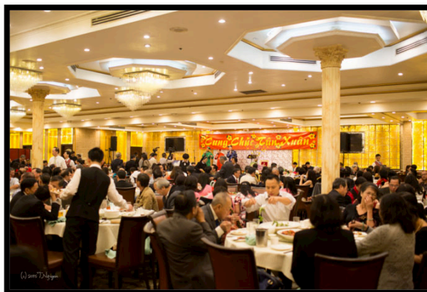
Đông đảo thành phần Dân Chúa tham dự buổi tiệc