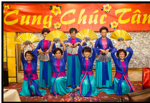
Văn nghệ mừng xuân ☞