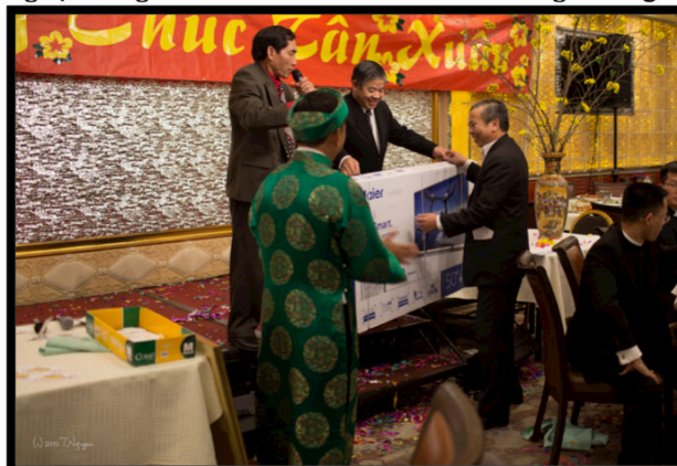
Xổ số trúng thưởng ☜