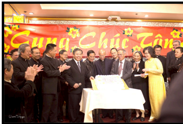
Quý Linh mục, Tu sĩ, Chức sắc cùng nhau cắt bánh mừng kỷ niệm 35 năm thành lập Cộng Đồng.

LTS: Vào Thứ Sáu ngày 13 tháng 2, 2015 Cộng Đồng Công Giáo Việt Nam, Tổng Giáo Phận Los Angeles đã tổ chức tiệc tất niên tại thành phố Rosemead để “tổng cựu nghinh tân” tiễn năm Giáp Ngọ đón năm Ất Mùi. Đây là dịp để tất cả các Cộng Đoàn, Ban Ngành Đoàn Thể gặp gỡ, hàn huyên, sống tình cảm tạ tri ân trong dịp mừng kỷ niệm 35 năm thành lập Cộng Đồng Công Giáo đầu tiên tại Hải ngoại. Hiện diện tại buổi tiệc này có đầy đủ mọi thành phần Dân Chúa từ quý Cha, quý Tu sĩ, Phó tế, Chức sắc vùng miền, Cộng đồng, Cộng đoàn và giáo dân. Ban Truyền Thông xin gửi đến quý vị một số hình ảnh được PV. Thành Nguyễn ghi lại tại sự kiện trên và xin mời vào trang web của Cộng đồng tại địa chỉ: Vncatholica.net để xem thêm hình ảnh và tin tức.