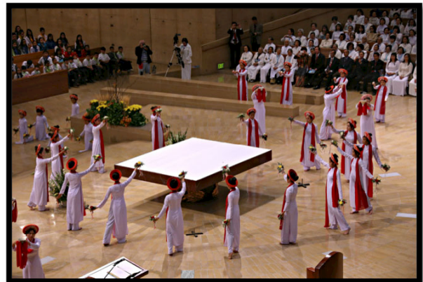
Vũ phụng vụ