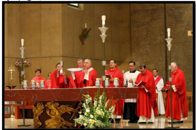
Thánh lễ đại trào do Đức TGM Jose Gomez chủ tế