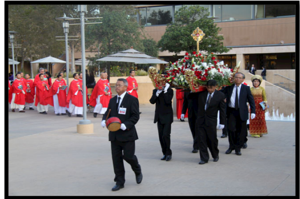
Cung nghinh Hài Cốt Các Thánh Tử Đạo Việt Nam vào thánh đường Our Lady of the Angels