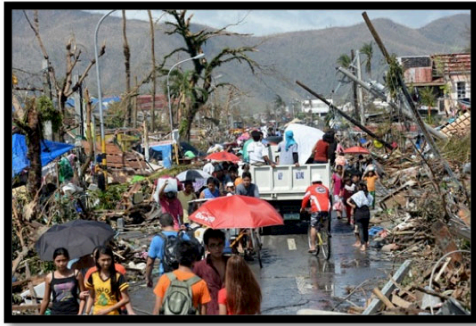
Cảnh hoang tàn sau cơn bão Haiyan.

Hình ảnh sinh động của nhiều tỉnh thành Philippines bỗng chốc trở thành bình địa sau cơn siêu bão kinh hoàng mang tên Haiyan. Sức gió trên 190MPH (300km/h) cộng thêm mưa to nước lớn, đã đánh sập nhiều cơ sở hạ tầng, cuốn văng hàng ngàn ngôi nhà, cướp đi hàng vạn sinh mạng, đẩy hàng triệu người vào cảnh màn trời chiếu đất.