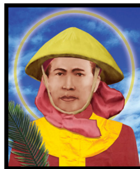
Thánh Andre Trông