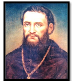
Thánh Stêphanô Thêôđorô Thê