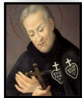
T. Phaolô Thánh Giá (1694 - 1775)