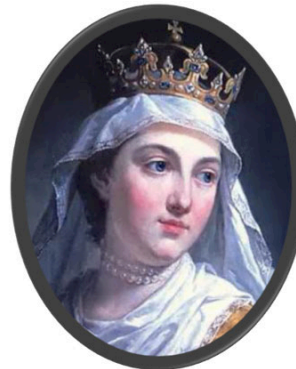
Thánh Hedviga (1174 - 1243)