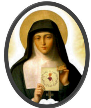
Thánh Margarita Maria Alacoque (1647 - 1690)