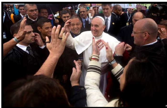
ĐTC chào từ biệt mọi người, lên đường trở về Vatican và hẹn gặp lại tại Ngày Giới Trẻ lần tới vào năm 2016 tại Krakow – Balan.