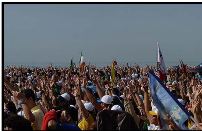
Hơn 3 triệu bạn trẻ đã đổ về bãi biển Copacabana để tham dự thánh lễ bế mạc vào ngày 28-07-2013