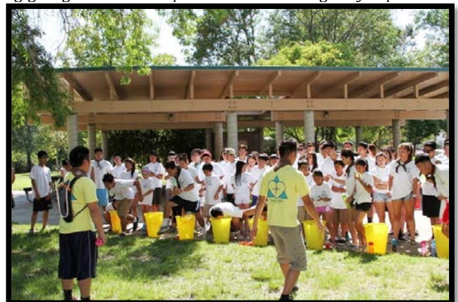
Các em hăng hái tham gia trò chơi thi đua theo đội