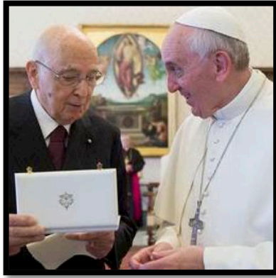
ĐTC tiếp kiến Ông Giorgio Napolitano, Tổng thống Italia, Vào ngày 8/6/2013

Trong buổi tiếp kiến Tổng thống Giorgio Napolitano của Italia sáng mùng 8 tháng 6 năm 2013, Đức Thánh Cha Phanxicô nhấn