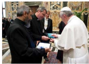
Đức giáo hoàng bắt đầu khai trương ứng dụng Missio

Bằng động tác bấm vào nút "Evangelizantur" (tiếng Latinh, có nghĩa là "Họ được loan báo Tin Mừng") trên màn hình chiếc iPad, Đức Giáo Hoàng Phanxicô trở thành vị Giáo Hoàng đầu tiên khai trương một ứng dụng mới dành cho điện thoại thông minh và mở rộng dấu chân của Giáo Hội trong thế giới kỹ thuật số. Ứng dụng Missio này của Hội Giáo Hoàng Truyền Giáo - dành cho các thiết bị di động và điện thoại thông minh - tập hợp các tin tức từ Vatican, những câu chuyện và hình ảnh truyền giáo và các tài liệu khác để có thể dễ dàng truy cập khắp thế giới.