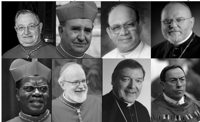
Hình Nhóm Cố Vấn theo thứ tự 1 – 8 (từ trái qua phải, từ trên xuống dưới)