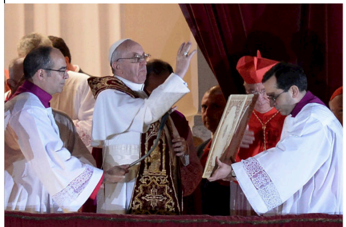
6. Ưu ái ban phép lành đầu tay, trên cương vị Giáo Hoàng, cho thành Rôma và toàn thế giới