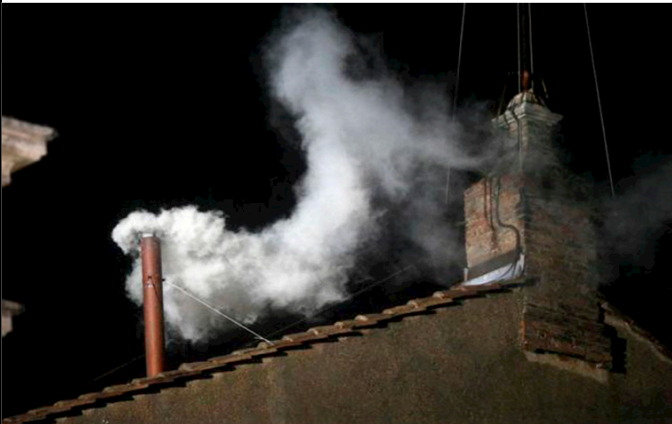
1. Đúng 7 giờ 7 phút Thứ Tư ngày 13 tháng 3 năm 2013 giờ Vatican, khói trắng từ nhà nguyện Sistine đã lan tỏa

LTS – Mật Nghị (Cơ Mật Viện) đã chính thức bầu chọn Đức Hồng Y Jorge Mario Bergoglio làm vị Giáo Hoàng thứ 266 vào Thứ Tư ngày 13 tháng 3 năm 2013. Dưới đây là những hình ảnh lịch sử được các thông tấn xã AP, AFP, Romereport ghi lại trong giờ phút đăng quang của Đức Thánh Cha Phanxicô.