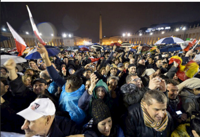
2. Hàng chục ngàn người giơ cờ, vẫy tay òa trong vui sướng khi thấy khói trắng bay lên, bắt chập trời lạnh và đang mưa