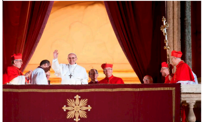
4. Đức Thánh Cha Phanxicô xuất hiện trên ban công Vương Cung Thánh Đường Thánh Phêrô, mỉm cười vẫy tay chào mọi tín hữu tại quảng trường cũng như trên toàn thế giới đang theo dõi trực tiếp qua các phương tiện truyền thông.