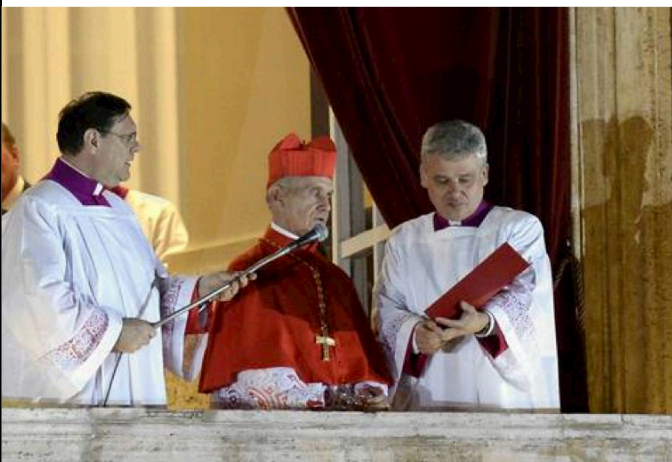
3. Đức Hồng Y Jean-Louis Pierre Tauran – Trưởng Đẳng Phó Tế - ra tuyên bố: “Habemus Papam” Chúng ta đã có Giáo Hoàng, nói tên HY được chọn và Tông Hiệu Giáo Hoàng