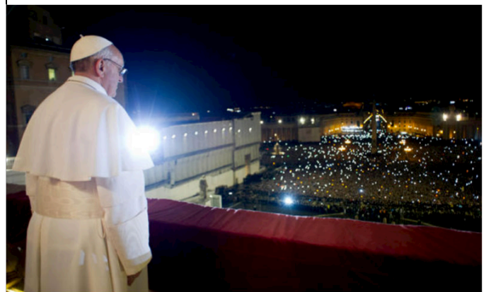
5. Trìu mến nhìn xuống đoàn chiên và...