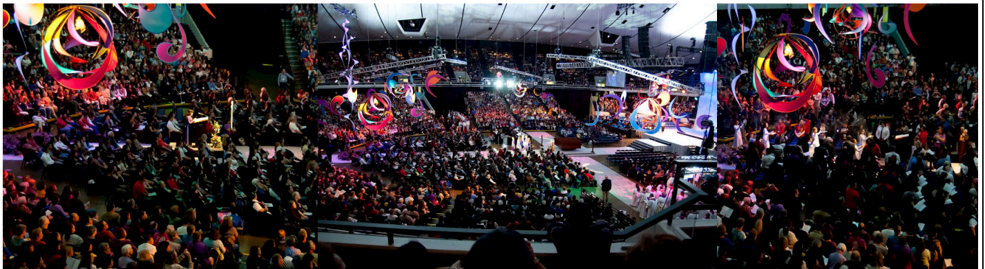
Quang cảnh hội trường lớn ↗

LTS – Đại Hội Giáo Lý (RECongress) được TGP/LA tổ chức hằng năm là nơi quy tụ hàng chục ngàn tham dự viên đến từ nhiều nơi trong và ngoài nước để học hỏi, trao dồi kiến thức về đời sống tâm linh và cuộc sống. Năm nay ĐHGL được tổ chức từ ngày 21-24 tháng 2 với chủ đề “Enter the Mystery” (Bước Vào Mầu Nhiệm). Mời quý độc giả theo dõi những hình ảnh về Đại hội do phóng viên Nguyễn Đình Anh ghi lại sau đây: