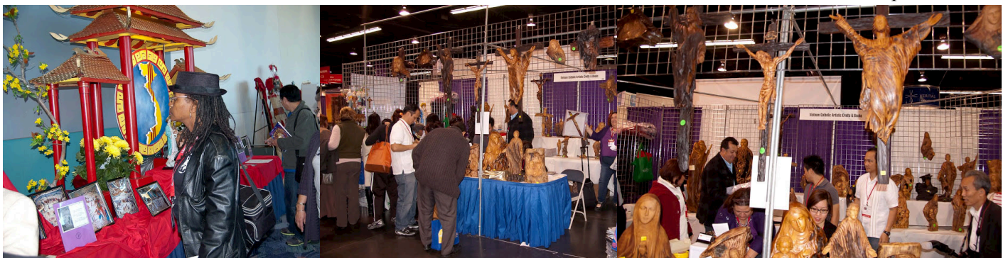
☞ Quầy triển lãm của CĐCGVN/TGP/LA và gian hàng bán tượng ảnh thủ công nghệ ↗