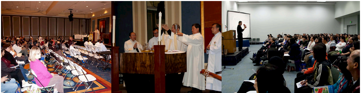
Thánh lễ Việt Nam ↗