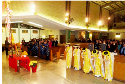
Nghi Thức Dâng Hương