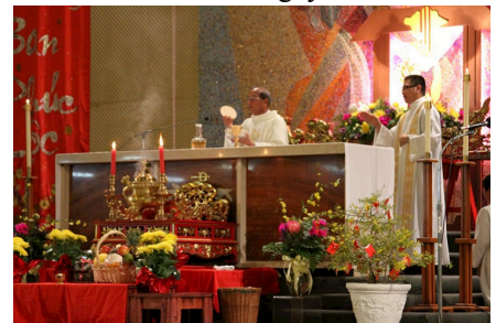
Cung Thánh được trang trí gồm: bàn hương án với hoa quả, kiệu Các Thánh Tử Đạo Việt Nam và hai câu đối dài 7m “Xuân Quý Ty Chúa Kháng Ban Phúc Lộc Năm Đức Tin Con Lành Nhận Hồng Ân”