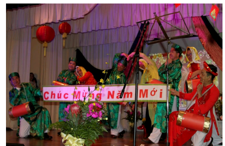
Văn Nghệ Mừng Xuân Quý Ty 2013 thu hút hàng trăm người trong và ngoài Cộng đoàn đến tham dự