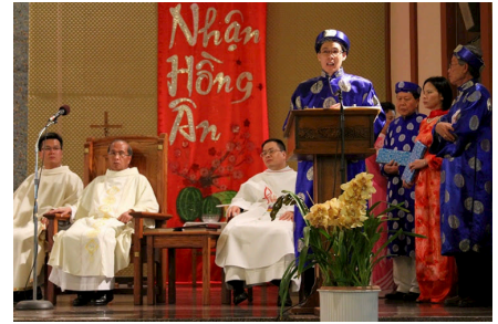
Thánh Lễ Giao Thừa ngày 9/2 ⇄ Thánh Lễ Tân Niên ngày 16/2 ⇄