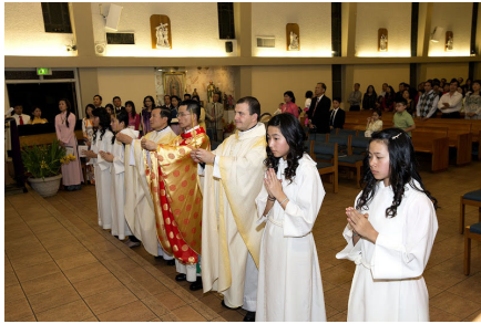
Nghi Thức Dâng Hương