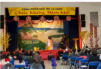
Văn nghệ mừng xuân tại Hội trường