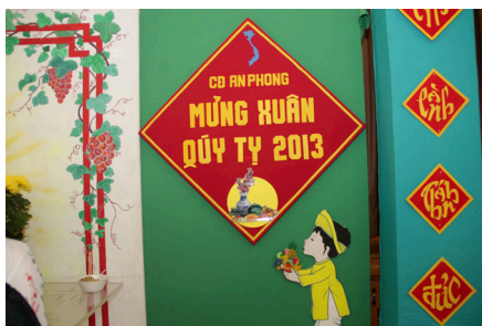
Trang trí bàn thờ tại Hội trường