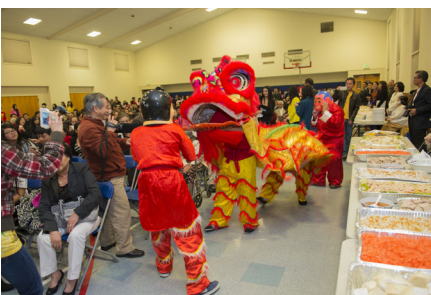
Múa lân vui xuân