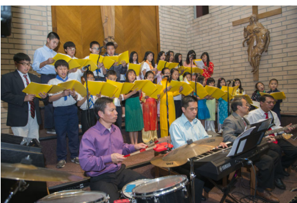
Ca Đoàn Thiếu Nhi hát lễ Tân niên