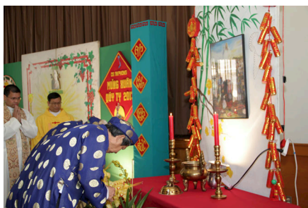
Nghi thức dâng hương