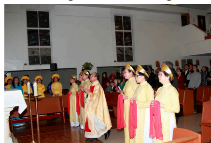
Nghi Thức Tế thiên