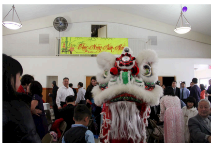
Múa lân, lì xì...