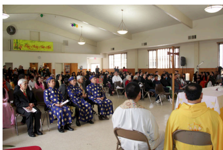
Cộng đoàn tham dự Lễ Tân niên