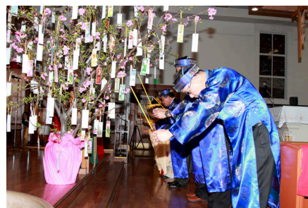
Nghi Thức dâng hương