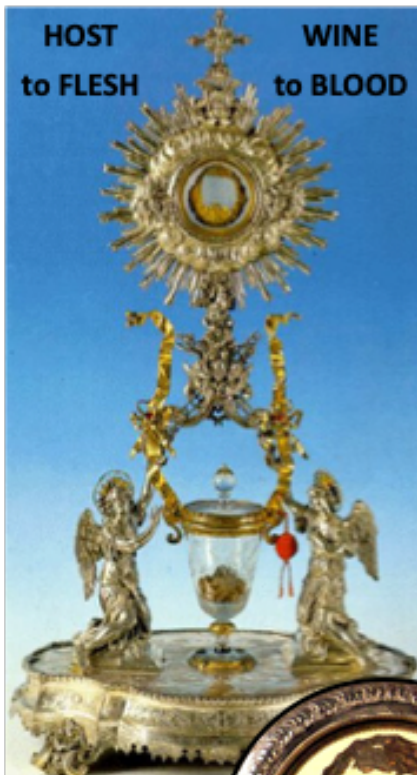
Miracle at Lanciano Italy 8th Century

25511 Eshelman Ave., Lomita (310) 326-3364