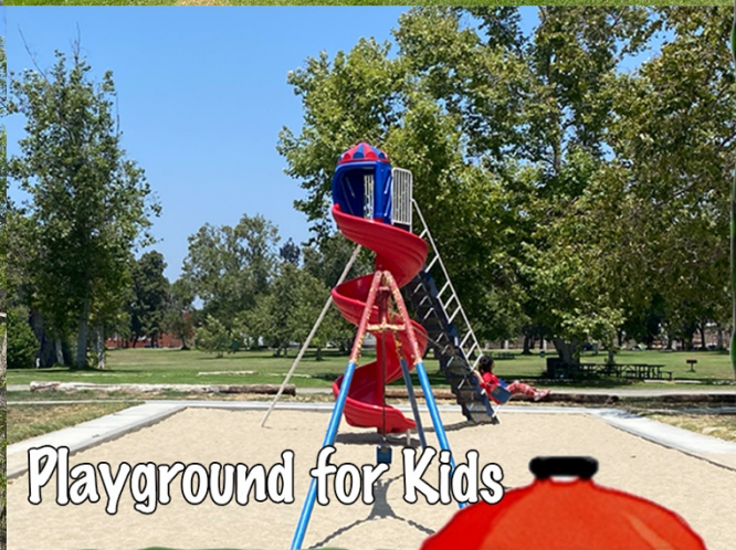
Playground for Kids