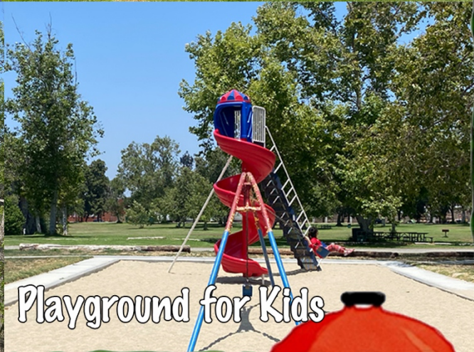
Playground for Kids