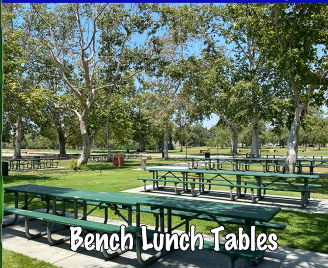
Bench Lunch Tables

7550 E. Spring St., Long Beach, CA 90815