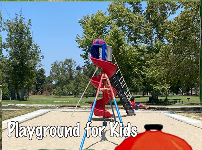
Playground for Kids