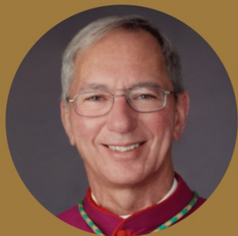
Most Rev. Marc V. Trudeau, D.D., V.G. Chủ tế Thánh lễ | Celebrant

1:30 pm - 2:30 pm: Tập trung | Gathering 2:30 pm - 2:45 pm: Rước kiệu | Procession 2:45 pm - 3:00 pm: Nghi thức tưởng niệm | Recollection 3:00 pm - 3:45 pm: Tĩnh huấn | Retreat 4:00 pm - 5:30 pm: Thánh lễ trọng thể | Solemn Mass