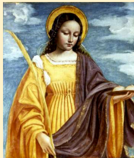
Thánh Agata, Đồng Trinh Tử Đạo – Kính ngày 5 tháng 2

Thánh Agata sinh tại Sicilia trong một gia đình danh giá. Các chị em của người là Anê, Lucia và Cêcilia đã đổ máu ra mình chứng Chúa Kitô dưới thời bạo