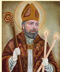
Thánh Blasiô, Giám Mục. Tử Đạo (316) – Kính ngày 3 tháng 2

Tương truyền rằng từ thuở bé, Agata đã hứa giữ mình đồng trinh. Nhưng quan trấn ở Sicilia là Quintianô ngờ ý xin cưới thánh nữ. Bị từ khước, ông tức giận bắt giam thánh nữ, lấy cớ ngài là người Công Giáo. Người ta đã hành hạ, khinh khi làm nhục ngài. Để trả thù, bạo quan hạ lệnh nướng ngài trên giường sắt. Sau đó, người ta lại tống giam thánh nữ. Lạ thay, trong đêm đó, thánh Phêrô đã hiện ra và chữa lành cho ngài. Dù bị quan trấn Quintianô nhiều lần dụ dỗ, ngài vẫn một lòng trung kiên với đạo Chúa. Dù đau đớn lẫn lộn trên than hồng và mảnh chai nhọn, ngài vẫn tin cậy vào Chúa, Đấng sẽ cứu linh hồn ngài. Chính cử chỉ của thánh nữ khiến cả thành phố náo động, Quintianô sợ dân nổi loạn nên truyền giam thánh nữ trong ngục. Ngài đã chết rũ tù ngày 05/12/251. Thánh nữ đã làm nhiều phép lạ như che chở thành Catania khỏi hiểm họa núi lửa Etna. Ngay từ thời đó, người ta đã cầu khẩn và cậy trông vào sự cầu bầu của thánh nữ. Giáo Hội mừng kính ngài vào ngày 05/02 mỗi năm.