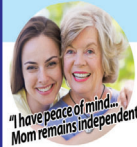
"I have peace of mind... Mom remains independent."