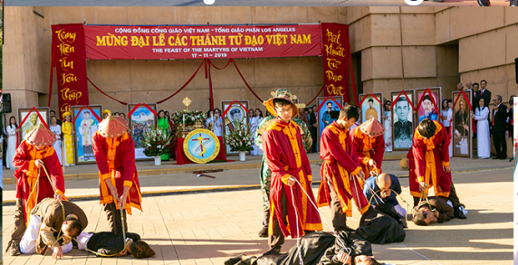
Diễn nguyện về cuộc tử đạo của Các Thánh Tử Đạo Việt Nam