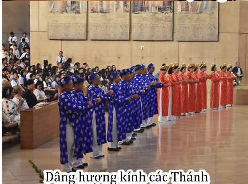
Dâng hương kính các Thánh