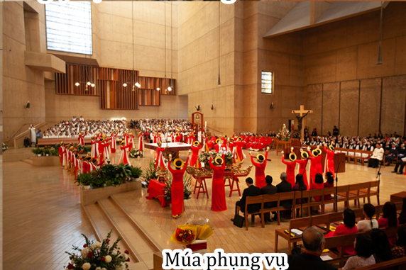
Múa phụng vụ