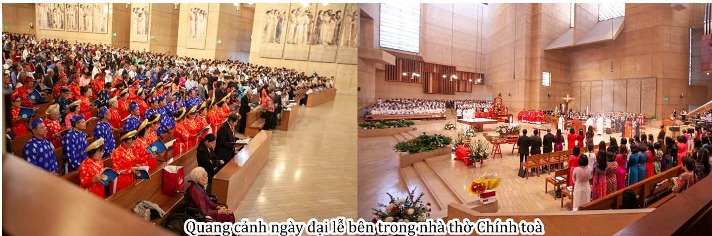
Quang cảnh ngày đại lễ bên trong nhà thờ Chính tòa