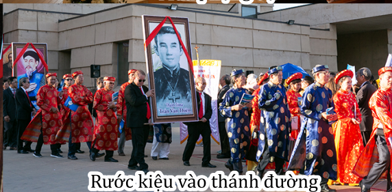
Rước kiệu vào thánh đường