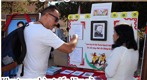
Khu trưng bày triển lãm về...