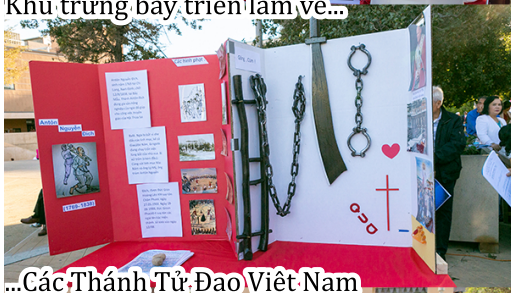
...Các Thánh Tử Đạo Việt Nam