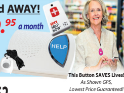
This Button SAVES Lives! As Shown GPS, Lowest Price Guaranteed!

GPS Tracking w/Fall Detection Nationwide, No Land Line Needed EASY Set-up, NO Contract 24/7 365 Monitoring in the USA