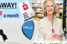
This Button SAVES Lives! As Shown GPS, Lowest Price Guaranteed!