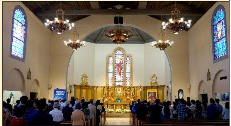
Cộng đoàn, BTV, quý chức Cộng đồng, quan khách, dự lễ Bốn Mươi, mừng kỷ niệm 40 năm thành lập Cộng đoàn ngày 4 tháng 8, 2019