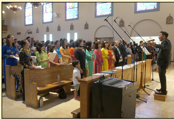
Ca đoàn dâng lời ca tiếng hát sốt sắng, tâm tình trong phụng vụ thánh lễ