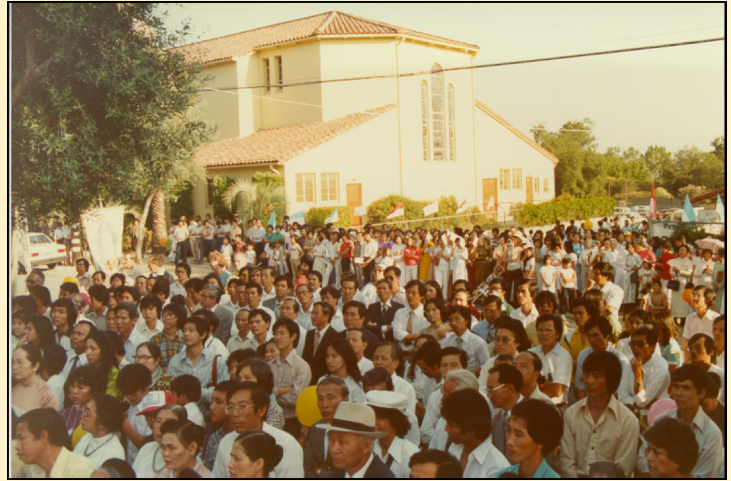
Cộng đoàn tham dự lễ Minh Niên vào đầu năm 90