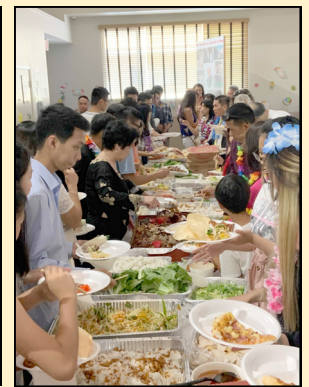
Tiệc mừng trong ngày sinh nhật cộng đoàn thứ 40