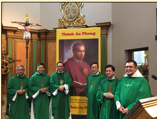
Cha Giám Phụ tỉnh, Cha Quản nhiệm, quý Cha Bề Trên DCCT đến Chủ tế và đồng tế thánh lễ