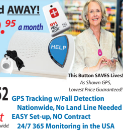
This Button SAVES Lives! As Shown GPS, Lowest Price Guaranteed!

MDMedAlert Safe-Guarding America's Seniors Nationwide!