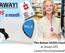
This Button SAVES Lives! As Shown GPS, Lowest Price Guaranteed!

GPS Tracking w/Fall Detection Nationwide, No Land Line Needed EASY Set-up, NO Contract 24/7 365 Monitoring in the USA