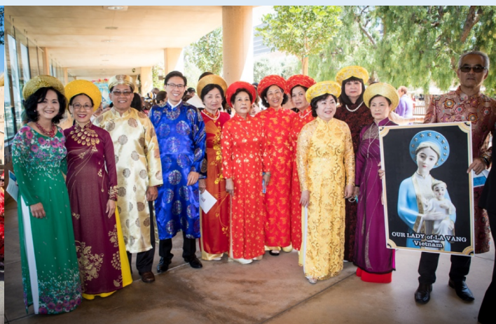
Phái đoàn sắc tộc Việt nam trong bộ trang phục truyền thống