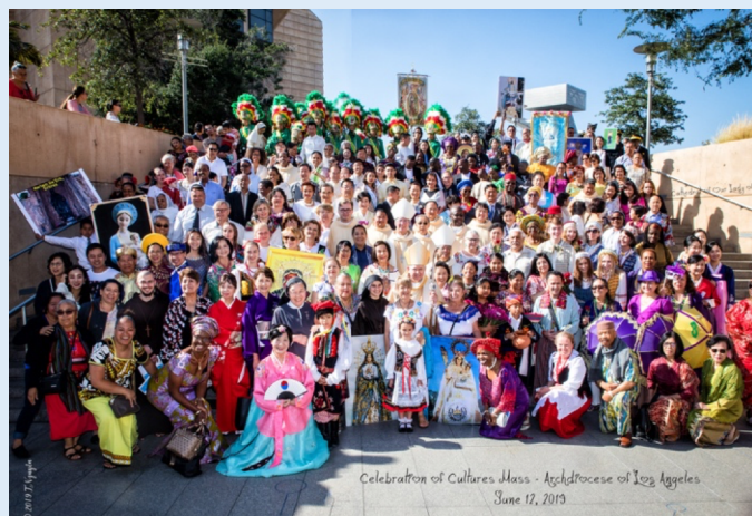
Hình chung các sắc tộc sau thánh lễ