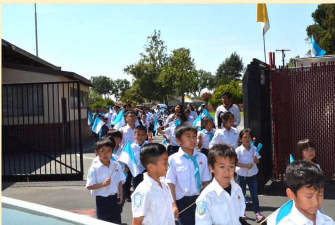
Đoàn Thiếu Nhi Fatima hoà chung cùng đoàn rước trong cuộc cung nghinh Đức Trinh Nữ Maria