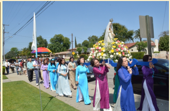
Buổi Cung Nghinh Đức Mẹ trong tháng hoa diễn ra trang nghiêm sốt sắng với mọi thành phần Dân Chúa tham dự