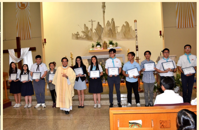
Trao giải Khuyến Học La Vang và Gương Sáng cho 12 em thiếu nhi chuẩn bị vào đại học