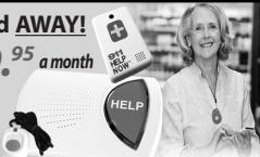
This Button SAVES Lives! As Shown GPS, Lowest Price Guaranteed!