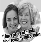
"I have peace of mind... Mom remains independent."