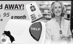
This Button SAVES Lives! As Shown GPS, Lowest Price Guaranteed!