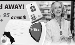
This Button SAVES Lives! As Shown GPS, Lowest Price Guaranteed!