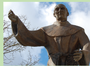
Chân phước Sêbastianô Apariciô (1502-1600)