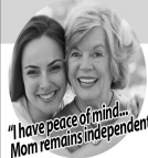
"I have peace of mind... Mom remains independent."